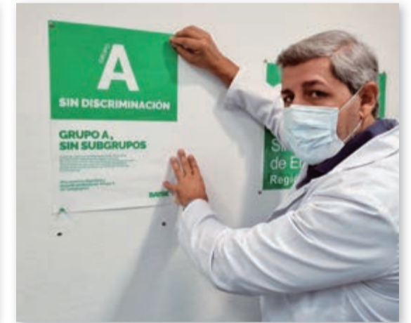
Delegado de SATSE en Atención Primaria en Murcia