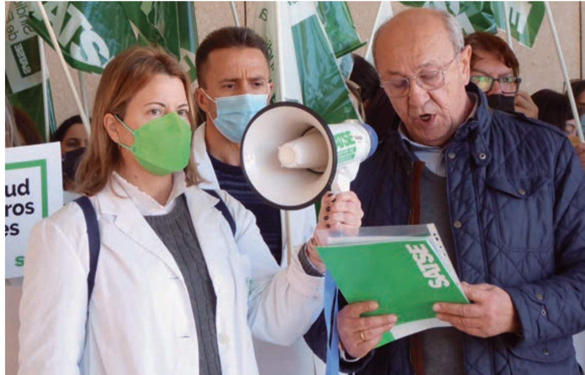
El secretario general de SATSE Murcia en la lectura de un manifiesto reivindicando la sanidad pública

que sufren actualmente en todos los ámbitos asistenciales.