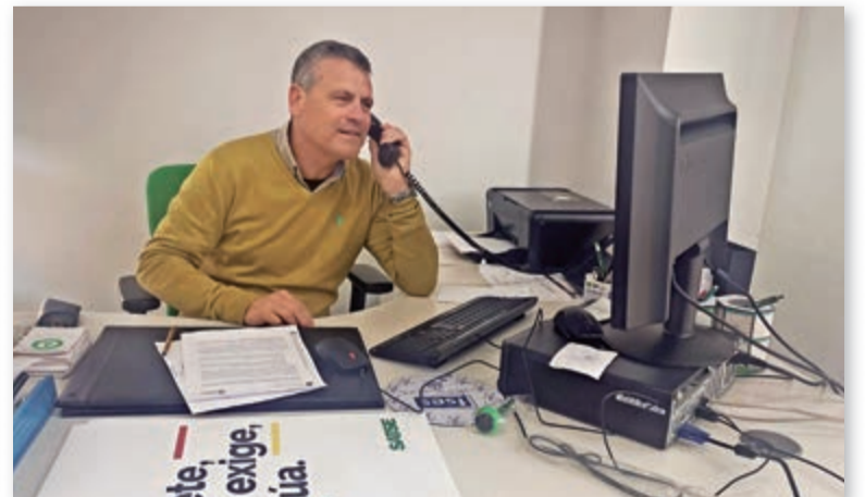
Delegado del IMAS