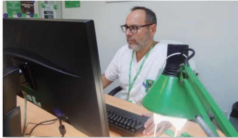
El delegado del Área IX (Vega Alta del Segura) en su despacho en Cieza