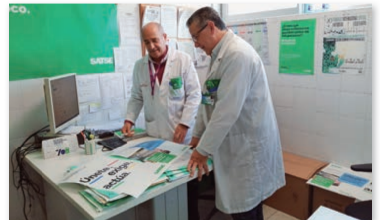
Delegados del Hospital Reina Sofía de Murcia