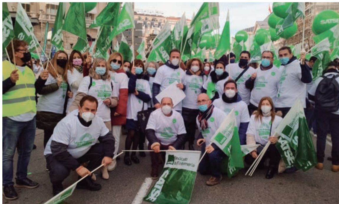
Los delegados y delegadas de SATSE Murcia han liderado la defensa de la Enfermería y Fisioterapia en todos los ámbitos de negociación, en los tribunales, en los centros sanitarios y en la calle

SATSE-FSES es la única organización sindical de carácter profesional que representa y defiende los intereses de enfermeros y enfermeras, especialistas y fisioterapeutas. Estos profesionales integran nuestras candidaturas y son la presencia cercana y directa del Sindicato en cada centro de trabajo.