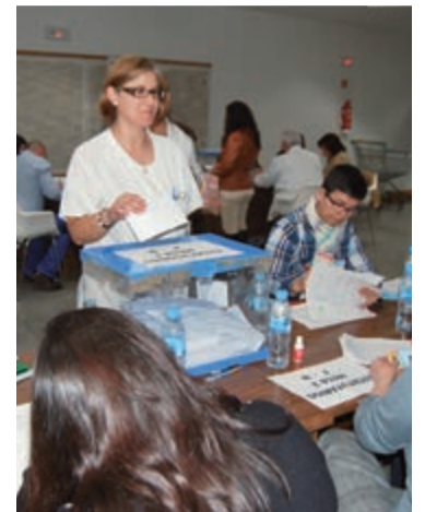
Profesionales ejerciendo su derecho al voto

¡IMPORTANTE! Si el día de la votación estás trabajando, aunque te hayan contratado ese mismo día, podrás ejercer tu derecho