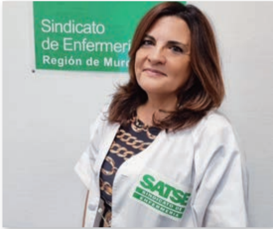
Delegada de AP en Murcia