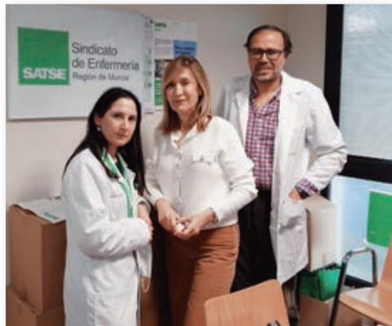
Delegados de SATSE en el Área 3