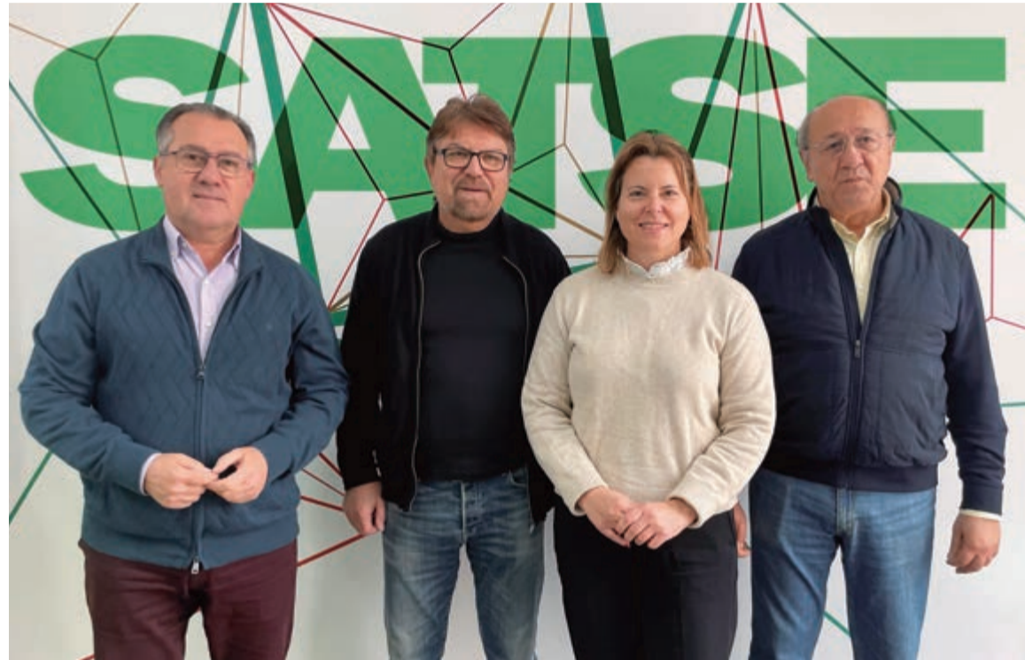
Comisión Permanente de SATSE en la Región de Murcia

También ha mejorado los módulos quirúrgicos en sus re-