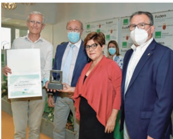
Momento de la entrega del premio a la Asociación de Usuarios de la Sanidad de la Región de Murcia por su trayectoria en la defensa de los derechos de los usuarios.