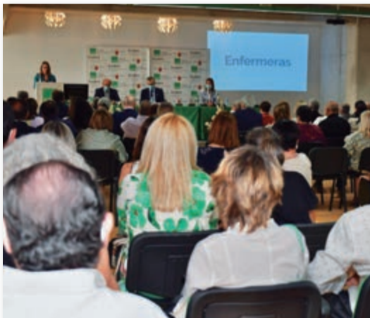
Momento del acto celebrado con motivo del 12 de mayo en la sede del Sindicato al que acudieron cientos de personas, entre autoridades y profesionales de Enfermería y Fisioterapia.