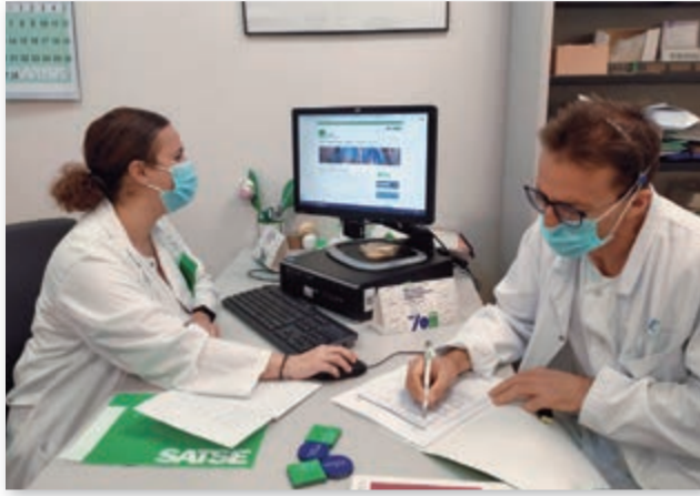
Delegados del Área 2 (Cartagena)

Las/os delegadas/os defienden en primera línea los intereses de enfermeras y fisioterapeutas