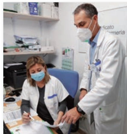
Delegados del Hospital Morales Meseguer