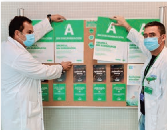
Delegados del Área VIII (Mar Menor)